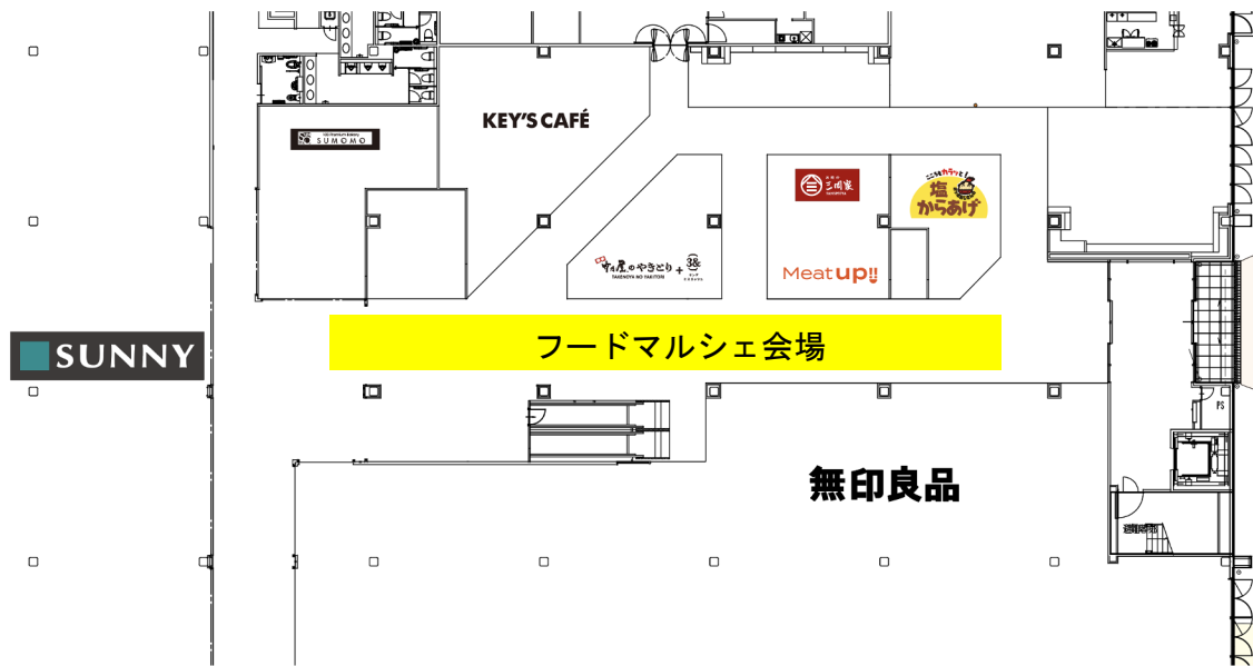
開催会場イメージ